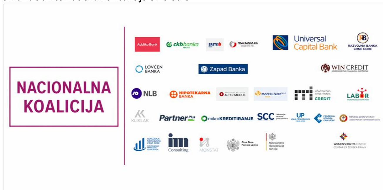
Slika 1: Članice Nacionalne koalicije Crne Gore

Nacionalni koordinator(i): Jedan ili više subjekata koje imenuje Nacionalna koalicija zaduženi su za koordinaciju sprovođenja Kodeksa, predlaganje osnovnih postavki Kodeksa, sazivanje sastanaka Nacionalne koalicije, praćenje preuzetih obaveza u okviru Kodeksa, održavanje javno dostupnih informacija o Kodeksu, te obezbjeđivanje da se napredak prati i izvještava na nacionalnom i globalnom nivou. Ova uloga može biti formalizovana kroz dokument sa jasno definisanim mandatom (opisom zadataka) usaglašenim od strane Nacionalne koalicije.