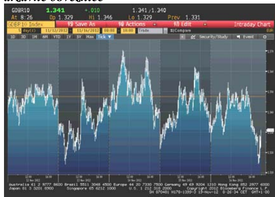
Kretanje prinosa na 10-godišnje benchmark njemačke državne obveznice