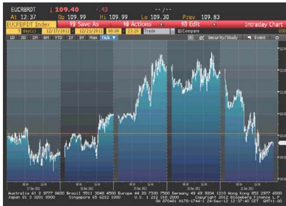
Cijena nafte na zatvaranju u dolarima za barel

Cijena sirove nafte je skoro čitave izvještajne nedelje rasla, da bi u petak pala. Glavni razlozi njenog rasta bile su spekulacije da će tražnja za gorivom rasti (koje su pokrenute znakovima ekonomskog rasta u SAD-u i Kini), optimizam da će američki zakonodavci postići dogovor o budžetu (čime će se izbjeći automatsko povećanje poreza i smanjenje potrošnje), izvještaji Američkog petroleum instituta i Ministarstva za energetiku SAD-a (koji su ukazali na pad zaliha sirove nafte), kao i podatak o većem rastu američke ekonomije od predviđanja (BDP je u III kvartalu povećan za 3,1%, a predviđen je rast od 2,7%). Pred kraj nedelje je cijena nafte bila na 2-mjesečnom maksimumu. Međutim, u petak je cijena ovog energenta značajno pala, zbog zabrinutosti da američke vlasti ipak neće uspjeti da se dogovore do 01. januara, što može ugroziti oporavak ove ekonomije. Pad je uzrokovan i izjavom naftnog Ministra Saudijske Arabije da se tražnja za sirovom naftom podudara sa ponudom i da je globalno tržište u ravnoteži.