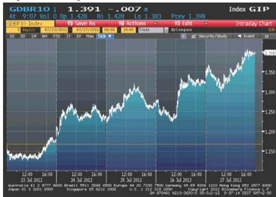
Kretanje prinosa na 10-godišnje benčmark njemačke državne obveznice