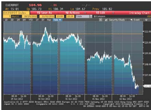
Cijena nafte na zatvaranju u dolarima za barel

Na samom početku nedelje cijena sirove nafte je pala na 3-mjesečni minimum, dok je cijena goriva bila u porastu, kako su rafinerije širom istočne obale SAD-a smanjile proizvodnju zbog prognoza da će uragan Sandy pogoditi ovaj dio. U utorak poslijepodne, cijena nafte se povukla sa ovog nivoa, uslijed spekulacija da će, nakon što je uragan prošao istočnu obalu, ipak doći do oporavka tražnje. Povlačenje uragana je, sredinom sedmice, ponovo pokrenulo rad rafinerija, pa je cijena bila stabilna. Na kraju nedelje cijena sirove nafte je imala silazni trend, pa se u petak kretala oko 4-mjesečnog minimuma, uslijed spekulacija da će zatvaranje rafinerija (iako su nastavile sa radom, rafinerije i terminali za snabdijevanje na sjeveroistoku su ostali zatvoreni) dovesti do povećanja ionako značajnih zaliha sirove nafte u SAD-u. Cijena je bila u padu i uslijed slabljenja cijena akcija i pada eura na 3-nedeljni minimum u odnosu na dolar, nakon objave slabih podataka o proizvodnji u euro regionu i jačih od očekivanja podataka sa američkog tržišta rada. Oprez investitora prije održavanja predsjedničkih izbora je takođe podržao opadajući trend na tržištu sirove nafte.