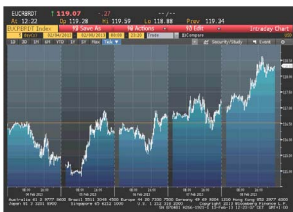
Cijena nafte na zatvaranju u dolarima za barel

Pon 115.36 min Uto 116.26 Sri 116.70 Čet 117.31 Pet 118.29 min