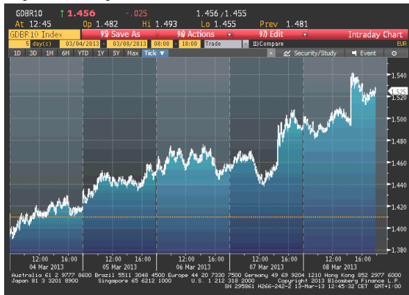
Kretanje prinosa na 10-godišnje benčmark njemačke državne obveznice