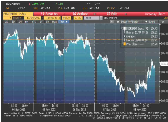
Cijena nafte na zatvaranju u dolarima za barel

U većem dijelu nedelje cijena sirove nafte se kolebala, ali je uglavnom imala opadajući trend kretanja, sve do poslednjeg dana izvještajnog perioda. Zbog porasta zaliha nafte u SAD-u i vijesti da će Libija povećati izvoz nafte, već u ponedjeljak je cijena ovog energenta slabila. Naredna dva dana cijena nije bilježila neka značajnija odstupanja. Veća promjena je nastala u četvrtak kada je cijena nafte pala na najniži nivo u poslednja više od 4 mjeseca, a razlog tome je bilo slabljenje eura u odnosu na dolar (nakon što je ECB-a neočekivano smanjila referentnu kamatnu stopu na rekordno nizak nivo), ali i podatak da je ekonomski rast SAD-a u III kvartalu zabilježio rast po stopi većoj od predviđanja (što je podstaklo spekulacije da će Fed redukovati stimulativne mjere). U petak se cijena neznatno oporavila, uslijed pozitivnih podataka sa tržišta rada SAD-a, koji bi mogli ukazati na održivi oporavak ove ekonomije.