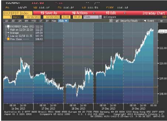
Cijena nafte na zatvaranju u dolarima za barel

donio odluku da redukuje mjesečni iznos kupovine obveznica uslijed poboljšanog ekonomskog outlooka za SAD rastući trend cijene sirove nafte je nastavljen. Na kraju nedelje cijena ovog energenta je dostigla 2-mjesečni maksimum, kako je objavljeno da je američka ekonomija u III kvartalu ostvarila rast po bržoj godišnjoj stopi nego što je prethodno procijenjeno (4.1% umjesto 3.6%).