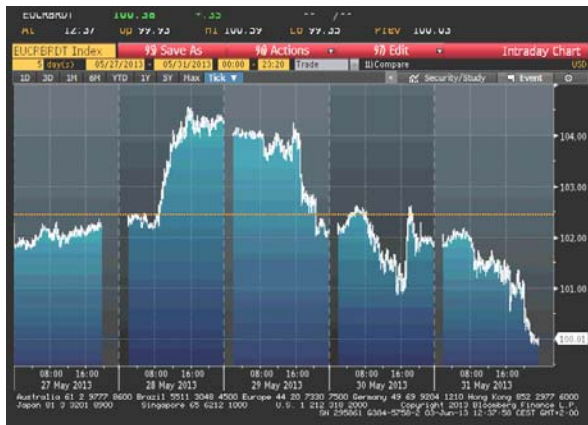
Cijena nafte na zatvaranju u dolarima za barel

Iako je tržište sirove nafte u ponedjeljak bilo prilično stabilno, u utorak je došlo do rasta cijene ovog energenta, uglavnom zbog zabrinutosti oko smanjenja obima isporuke iz Nigerije i Sjevernog mora. Rast je uzrokovan i rastom cijena akcija, kao i znakovima jačanja tržišta nekretnina u SAD-u i povjerenja potrošača. Međutim, od srijede je cijena nafte gotovo konstantno bila u padu. Zabrinutost da će Fed, uporedo sa naznakama jačanja američke ekonomije, pristupiti povlačenju stimulatívnih mjera, pokrenula je pad cijene sirove nafte. Industrijski izvještaj koji je pokazao da su zalihe nafte u SAD-u u porastu takođe je uticao na pad cijene, koja se u četvrtak kretala oko 4-nedeljnog minimuma. Izveštaj Ministarstva za energetiku je takođe ukazao na pad zaliha nafte i to najveći od 1931. godine, dok su zalihe goriva pale. Iako je istog dana na kratko došlo do oporavka, njen silazni trend je nastavljen. Tako je u petak cijena nafte bila na 1-mjesečnom minimumu (nešto ispod $100m za barel), kako je na sastanku OPEC-a u Beču donešena odluka da se nivo uoutputa ne mijenja sa postojećih 30 miliona barela nafte dnevno, iako analitičari smatraju da bi on trebao biti smanjen u uslovima rastućih zaliha. Pad cijene je izazvan i padom cijena akcija.