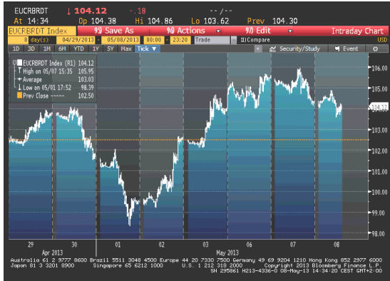
Cijena nafte na zatvaranju u dolarima za barel

Američki Petroleum Institut je objavio da su zalihe nafte porasle za 5.18 miliona barela tokom prethodne nedelje. Sredinom sedmice cijena nafte je nastavila da slabi uslijed negativnih podataka i Kine i SAD-a. Proizvodni sektor obje ove zemlje je porastao po manjoj stopi u aprilu od očekivane. U četvrtak je cijena nafte ostvarila oštar rast kako je objavljeno da su zahtjevi za primanje socijalne pomoći pali u SAD-u i kako je ECB smanjila kamatnu stopu. Poslednjeg dana cijena ovog energenta je porasla.