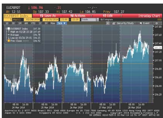
Cijena nafte na zatvaranju u dolarima za barel

U prvoj polovini nedelje cijena sirove nafte je uglavnom bilježila slabljenje. Izveštaj za koji se očekivalo da će pokazati da su zalihe sirove nafte porasle, pad industrijske proizvodnje u Kini, kao i zatvaranje jednog dijela kanala u Hjustonu (za koje se sumnjalo da će dovesti do poremaćaja operacija u rafinerijama na Golfskoj obali), su bili razlozi zbog kojih je došlo pada vrijednosti ovog energenta. U srijedu je cijena sirove nafte uspjela da se kratkotrajno oporavi kako je objavljeno da su zalihe u Cushingu, Oklahoma, pale osmu nedelju zaredom, i kako je tražnja za gorivom dostigla 3-mjesečni maksimum. U četvrtak je vijest o zalihama nafte i dalje uticala na rast cijene koja se na kraju dana našla na 2-nedeljnom maksimumu, a i Predsjednik SAD-a je upozorio da kriza u Ukrajini može da eskalira i da bi sankcije prema Rusiji mogle da uključe i energetski sektor. Posljednjeg dana je objavljeno da je lična potrošnja u SAD-u porasla u februaru, najviše u odnosu na prethodna tri mjeseca, što je dovelo cijenu ovog energenta na 3-nedeljni maksimum.