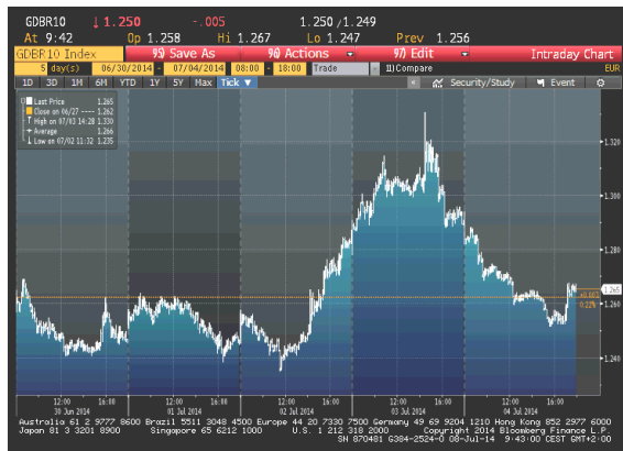
Kretanje prinosa na 10-godišnje benčmark njemačke državne obveznice